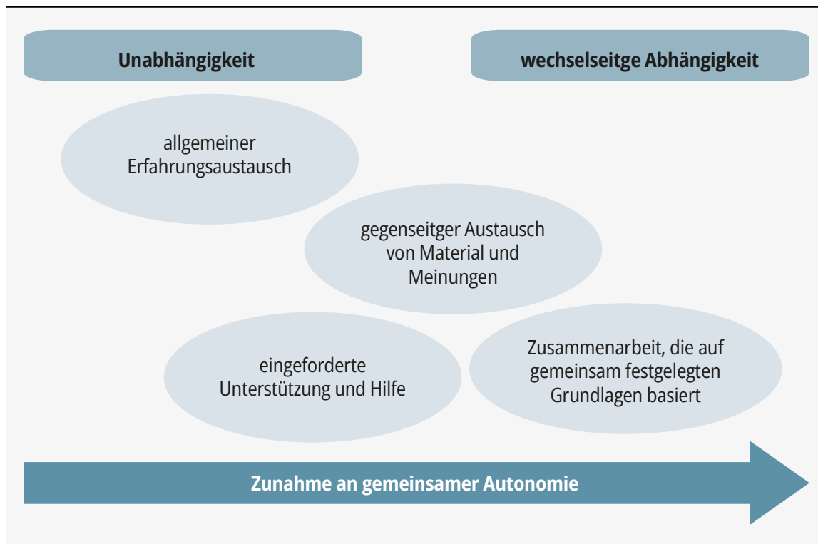
Abbildung 1: Stufen der Intensität bei der Zusammenarbeit (in Anlehnung an Little, 1990, S. 512)

Verstärkte Zusammenarbeit hat zwar eine wechselseitige Abhängigkeit zur Folge, geht aber nicht mit Autonomieverlust einher. Sie führt dazu, was Fussangel (2008) als «kollektives Autonomiekonzept» (S. 14) bezeichnet; das heisst, «die beteiligten Lehrpersonen [arbeiten] hochgradig interdependent, ihre Arbeit ist weitestgehend öffentlich und sie treffen Entscheidungen auf einer gemeinsamen Grundlage» (ebd.). Gerade wenn Kinder mit herausforderndem Verhalten integriert werden sollen, ist eine multiprofessionelle Zusammenarbeit unabdingbar (Karhu et al., 2020). Die folgenden Kapitel beschreiben die Aufgaben und Formen der Zusammenarbeit verschiedener Akteur:innen, welche in Bildungskontexten eine wichtige Rolle einnehmen.