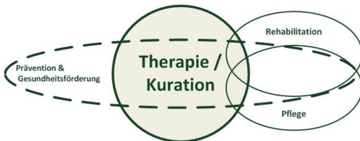
Abb. 1: vgl. "Vereinfachte Darstellung des Soll-Zustands der einzelnen Versorgungssegmente des Gesundheitssystems" (In: Hurrelmann 2010, S.21)